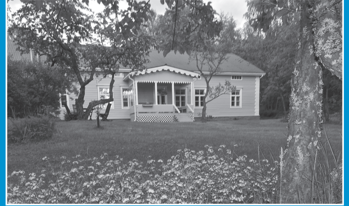
Puumalan pappila. The Puumala vicarage.